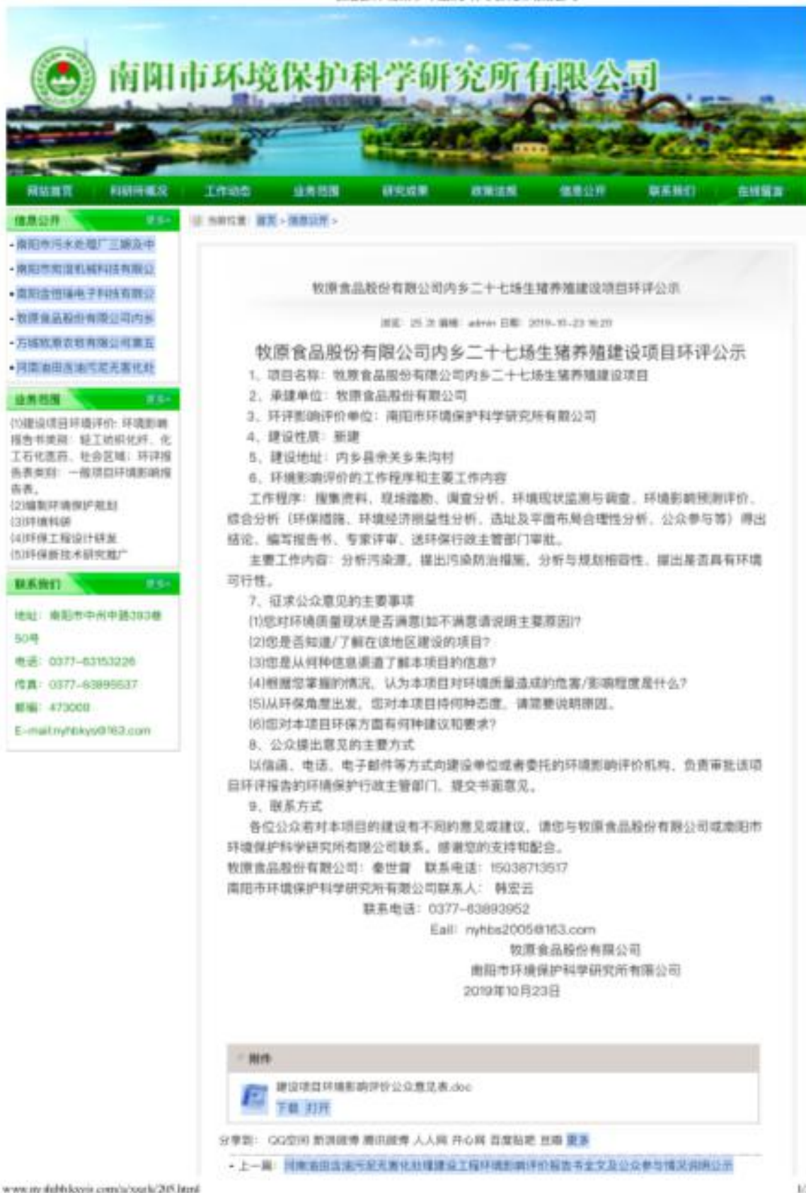
图2.1-1 首次环境影响评价信息公示截图